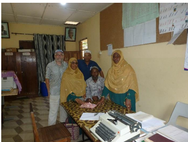
Ceremonie, met de overhandiging van de nodige fondsen