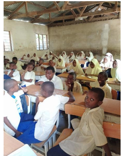
KIKADINI PRIMARY SCHOOL, Jambiani

In KIKADINI PRIMARY SCHOOL - ook in Jambiani – werden de daken van alle klassen vernieuwd: een oude verzuchting van de school, waar wij dit jaar eindelijk gevolg konden aan geven; het regende namelijk binnen in omzeggens alle klassen. Geen overbodige luxe, nu het grote regenseizoen gestart is.