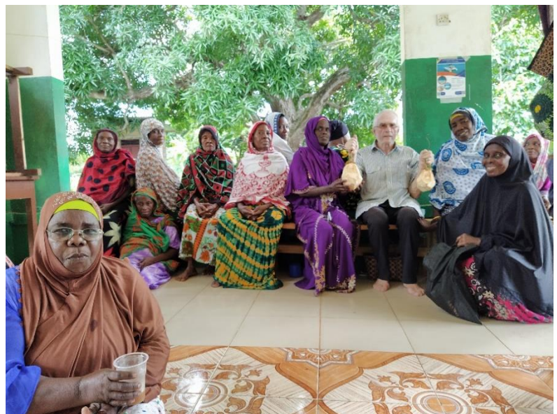
De vrouwengroep TUFHAMIANE in KIZIMKAZI